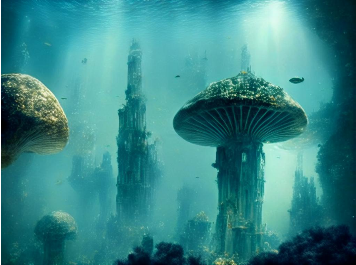
Still from visual mood board for project 'ReCharge' - UNDERWATER 2, Delic & Huda, 2024

RESET is onderdeel van de Fundatie Future Factory , het laboratorium van Museum de Fundatie. Multidisciplinaire makers gaan hier op zoek naar de hartslag van de tijd. Welke thema's bepalen de toekomst?